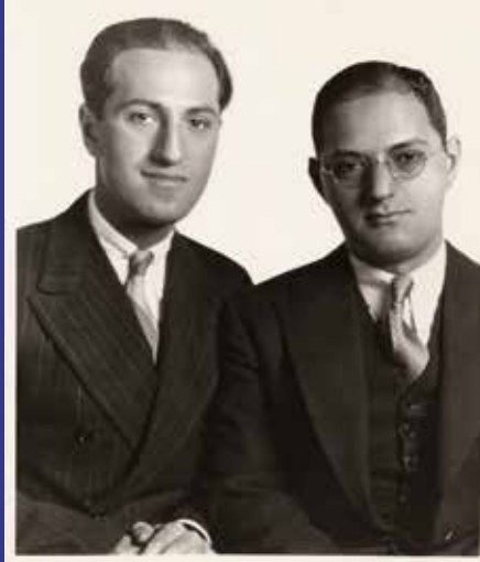
George i Ira Gershwin

GEORGE GERSHWIN urodził się 26 września 1898 roku w nowojorskim Brooklynie. Edukację muzyczną rozpoczął w wieku 13 lat. Trzy lata później porzucił naukę, by pracować jako prezenter piosenek w muzycznej firmie wydawniczej. Wkrótce skomponował pierwsze utwory, a wykonywana przez Ala Jolsona piosenka Swanee przyniosła mu rozgłos. Sławy przysporzyły mu także liczne komedie muzyczne. Większość z nich napisał wspólnie ze starszym bratem Iraw. Braterska spółka stworzyła m.in.: Lady, Be Good! , Oh, Kay! , Strike Up the Band , Girl Crazy oraz uhonorowaną Nagrodą Pulitzera – Of Thee I Sing . Od początku kariery George Gershwin pragnął komponować muzykę poważną. Zrealizował te plany w kilku mistrzowskich utworach, wśród nich są: Błękitna rapsodia , Concerto in F , Amerikanin w Paryżu i Second Rhapsody . Pod koniec lat dwudziestych zafascynowała go powieść DuBose'a Heywarda Porgy , uznał ją za doskonały materiał na libretto opery ludowej z wykorzystaniem muzyki bluesowej i jazzowej. Premiera opery Porgy i Bess odbyła się 30 września 1935 roku w Bostonie, a dwa tygodnie później wystawiono ją w Nowym Jorku. W 1937 roku, u szczytu kariery, George Gershwin zasnął podczas pracy nad partyturą do The Goldwyn Follies . Zmarł 11 lipca, mając niecałe 39 lat. Powodem śmierci był guz mózgu.